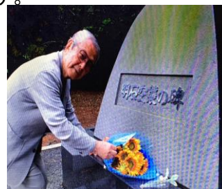
戦没慰霊碑に供花(明石公園)